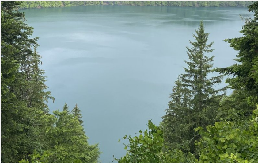
Vue depuis le point sublime (Juliette Amant)