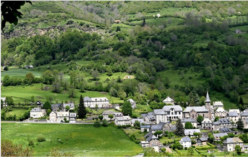
le bourg du Falgoux (Elisa Réveillaud)