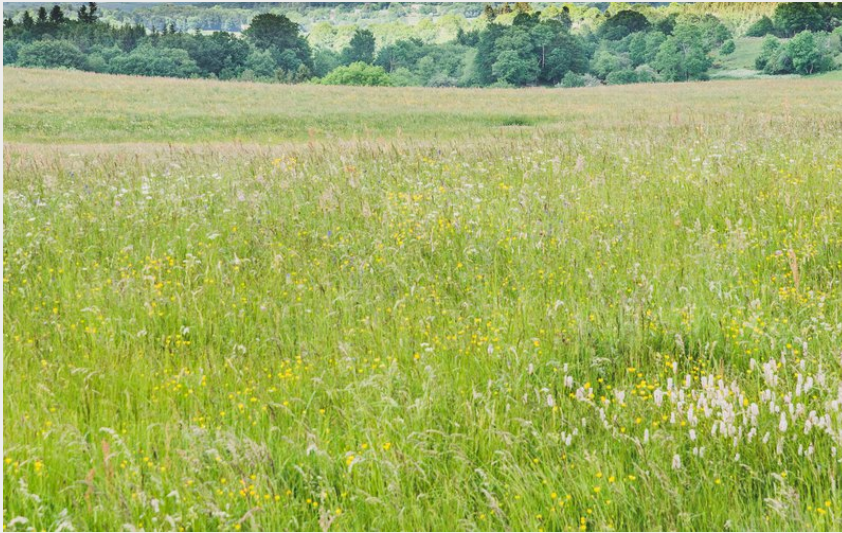
Vue sur la partie Sud du massif du Sancy (Eve Hilaire)