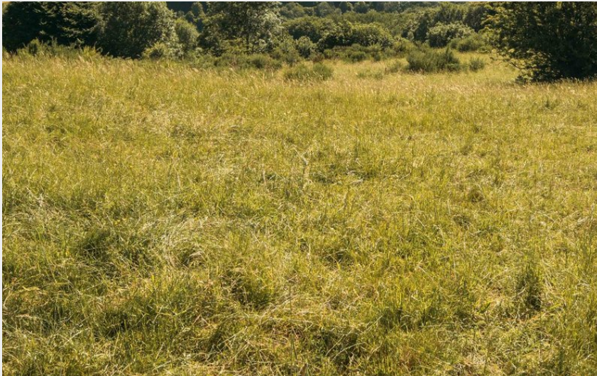
(Achille De Lievre)