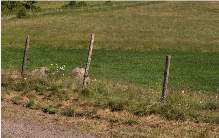
Cézallier (Achile De Lievre)