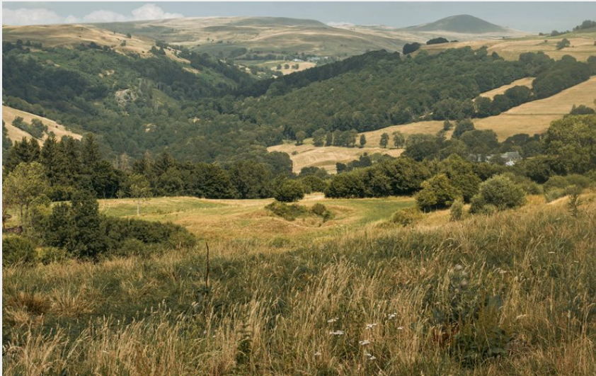
(Achile De Lievre)