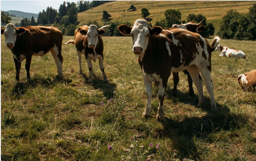
(Achile De Lievre)