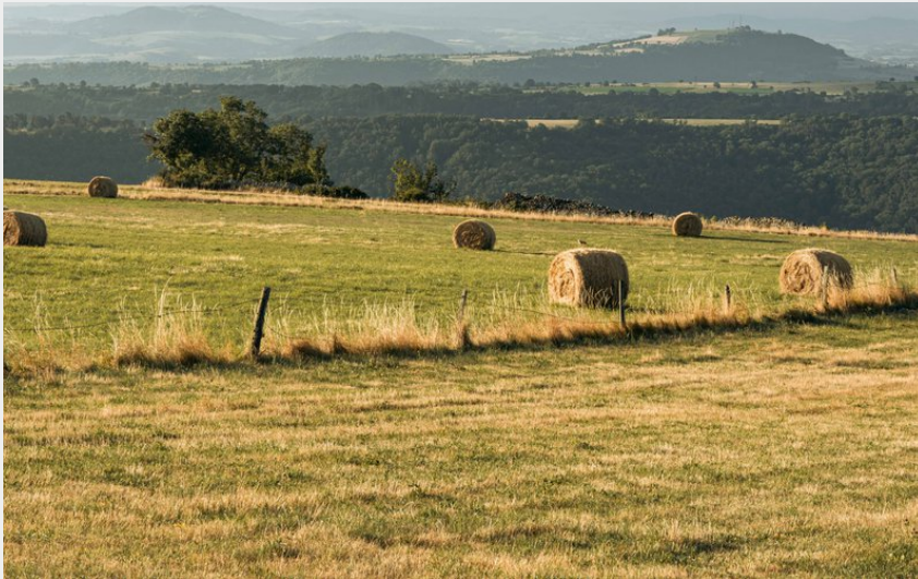
(Achile De Lievre)