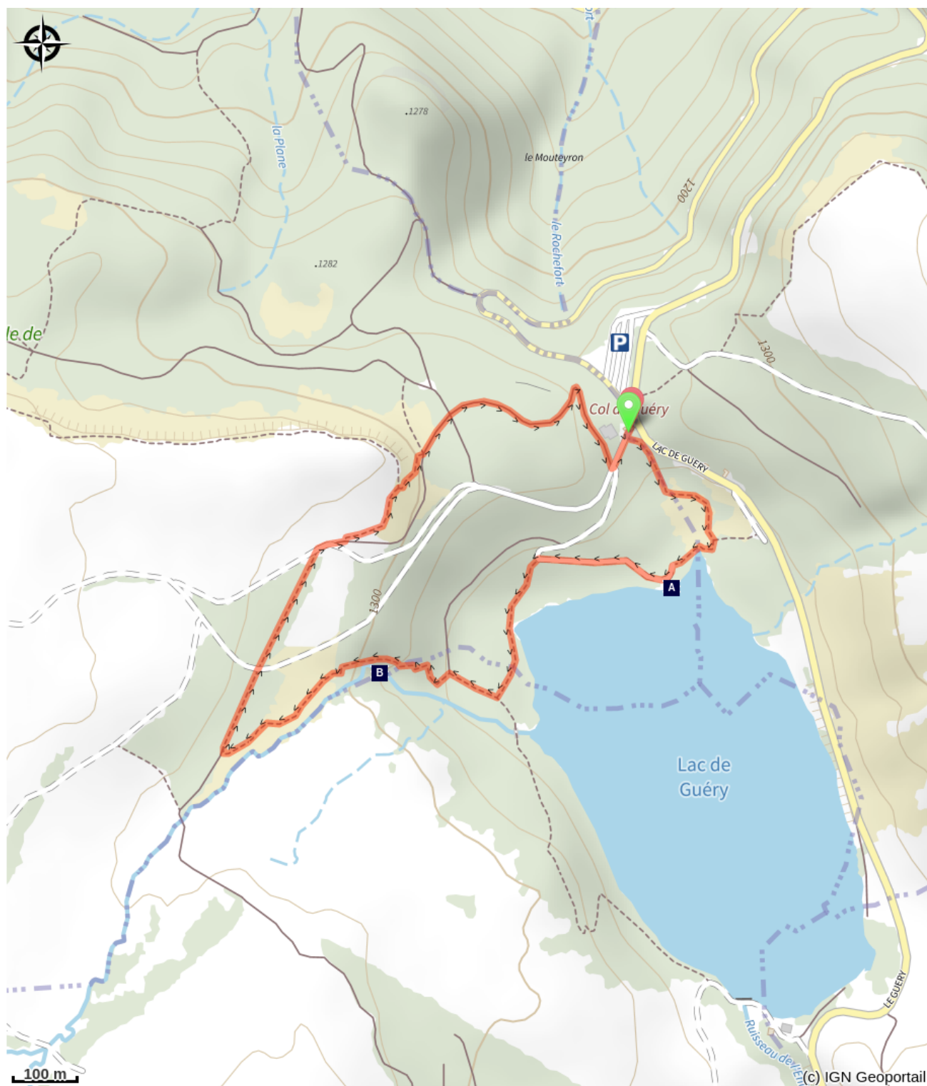
Le lac de Guéry (A)