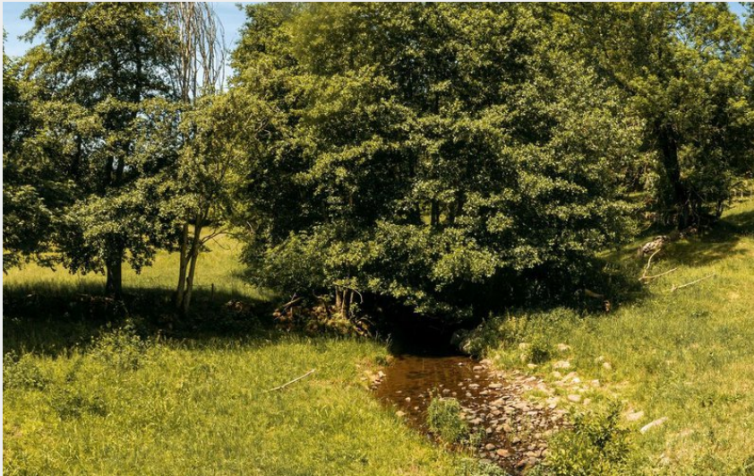
(Achille De Lievre)