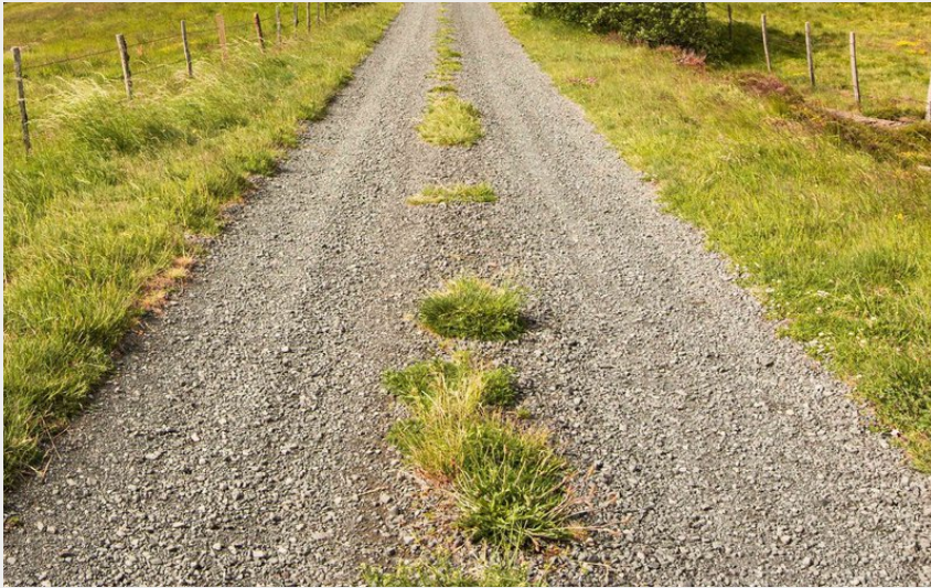
(Achile De Lievre)