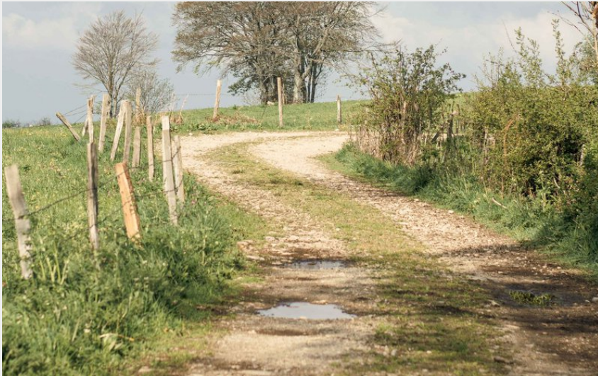
(Achile De Lievre)