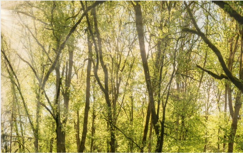
(Achile De Lievre)