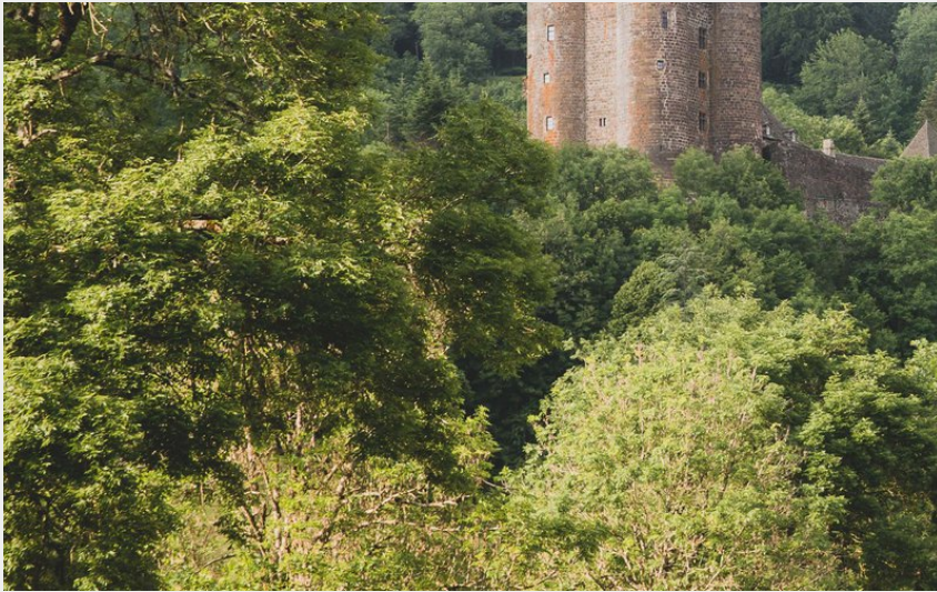
Le château d'Anjony (Eve Lancery)