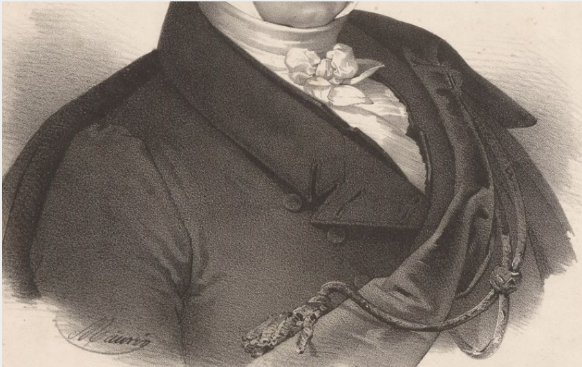
portrait du Comte de Montlosier (1826) (Nicolas-Eustache Maurin)