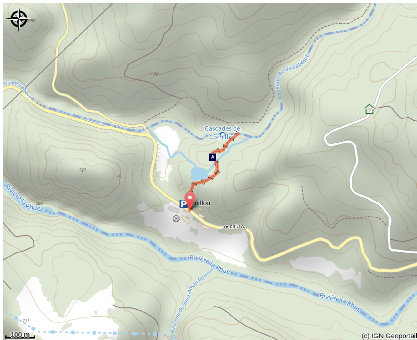
Le Pic noir (A)