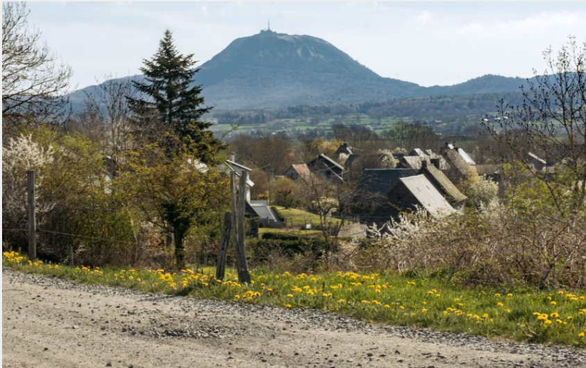
(Achille De Lievre)