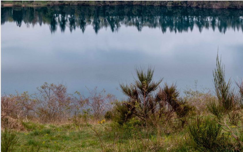
Le Gour de Tazenat (Achile De Lievre)