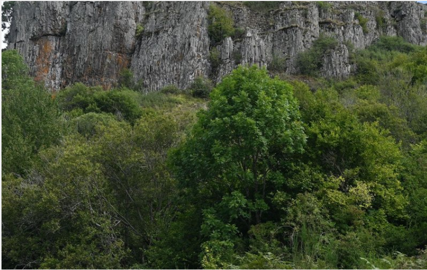
Les orgues volcaniques de Saint-Bonnet-de-Condât (Valérienne Monnet)