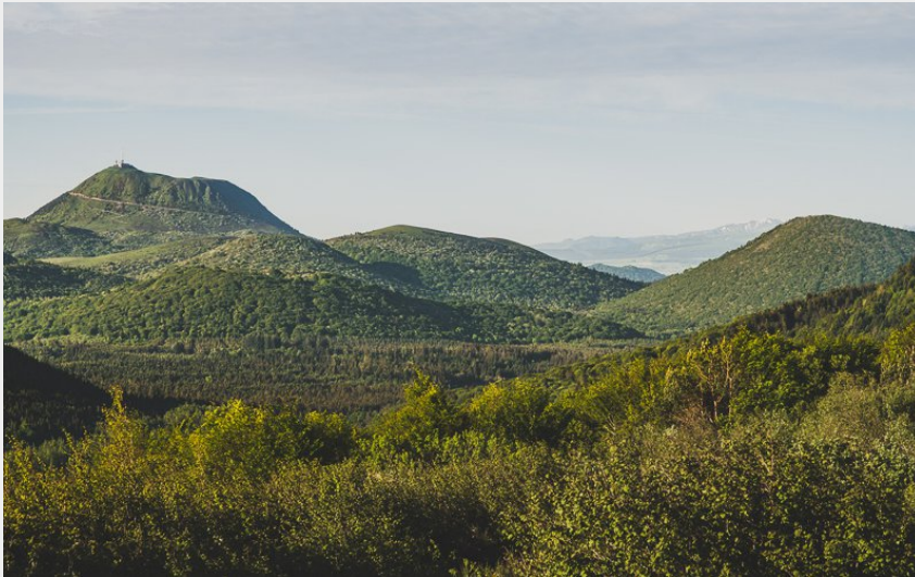
Paysage Monts Dômes (Eve Hilaire)