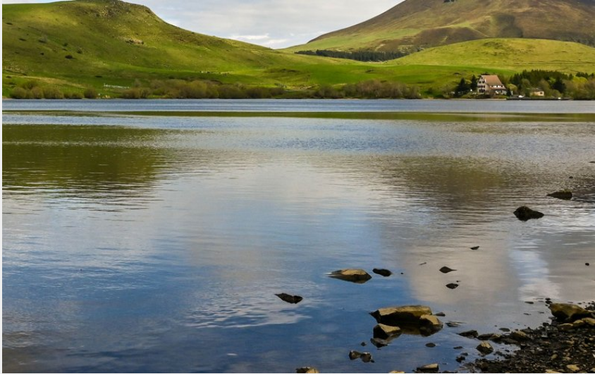
Vue sur le lac et l'Auberge de Guéry (Valérienne Monnet)