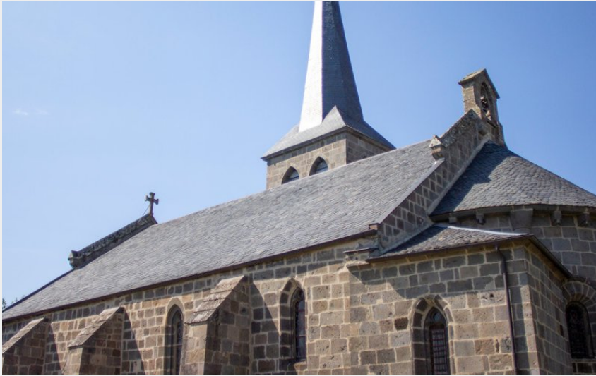
Crédit photo : Eglise Saint-Quintien (DR Office de tourisme du Sancy)