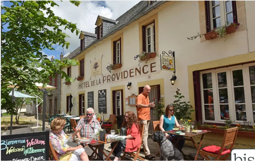
Crédit photo : Rando Bistrot à Saint-Donat (Auberge de la Providence)