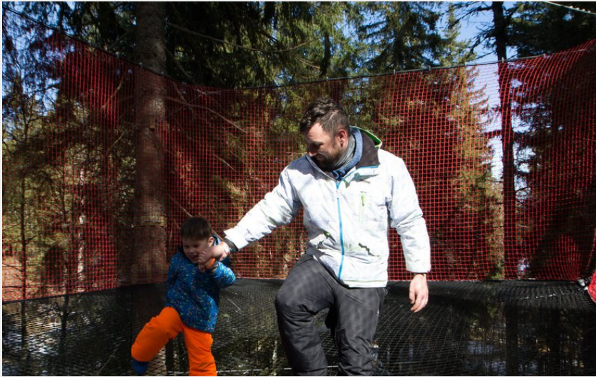
Parcours filets des Petits Ducs