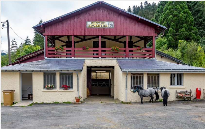
Crédit photo : Centre équestre de La Bourboule (DR Office de tourisme du Sancy)