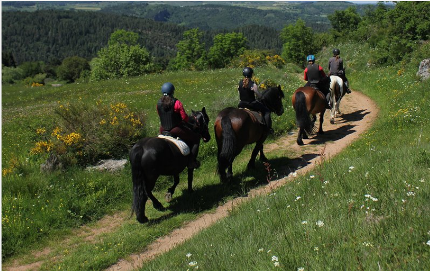
Crédit photo : Ferme équestre de Berthaire (DR Office de tourisme du Sancy)