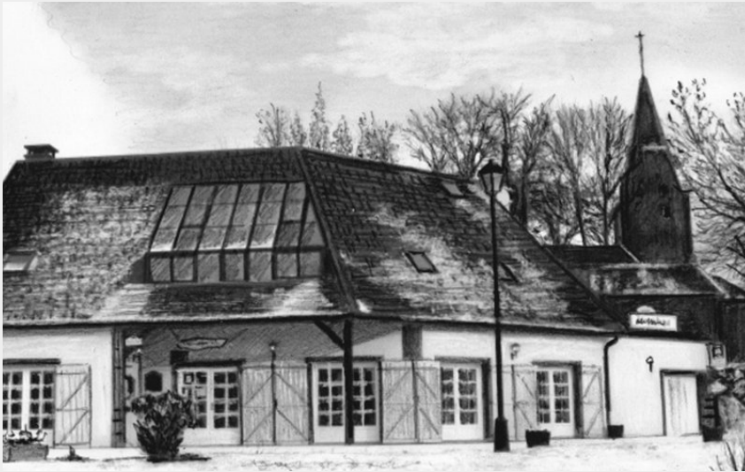
Crédit photo : L'Auberge du Bougnat (DR Office de tourisme du Sancy)